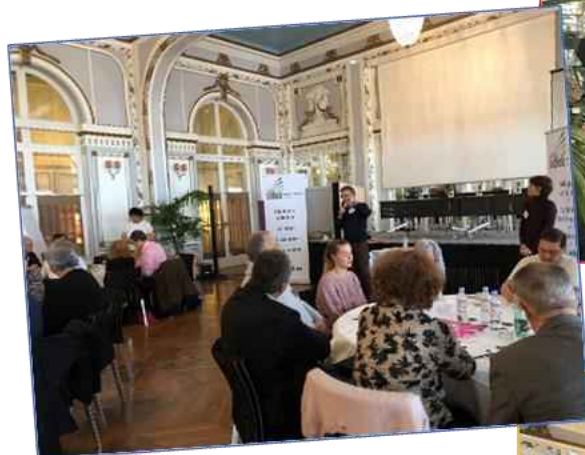
Explications des ateliers