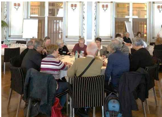
Séance de portait Chinois

La méthode des 6 chapeaux extraite de l'ouvrage « Six chapeaux pour penser » est une méthode de management personnel ou de groupe, développée par Edward de Bono , permettant de traiter les problèmes. Cette technique permet entre autres d'éviter la censure des idées nouvelles, dérangeantes, inhabituelles.