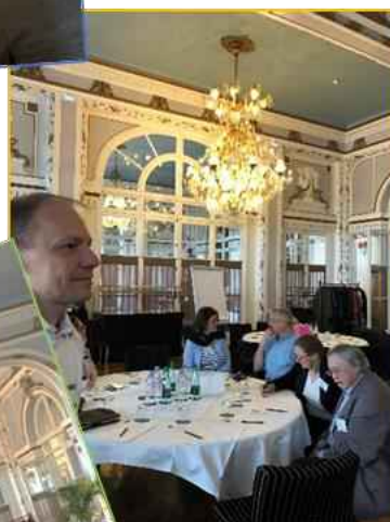
Réflexions en cours